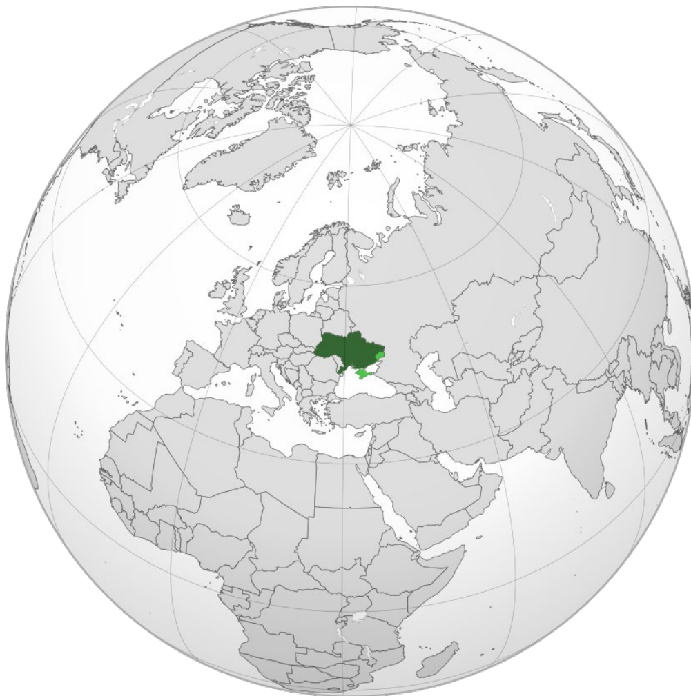
Ortografická mapa se středem na Ukrajinu, autor: M. Bitton